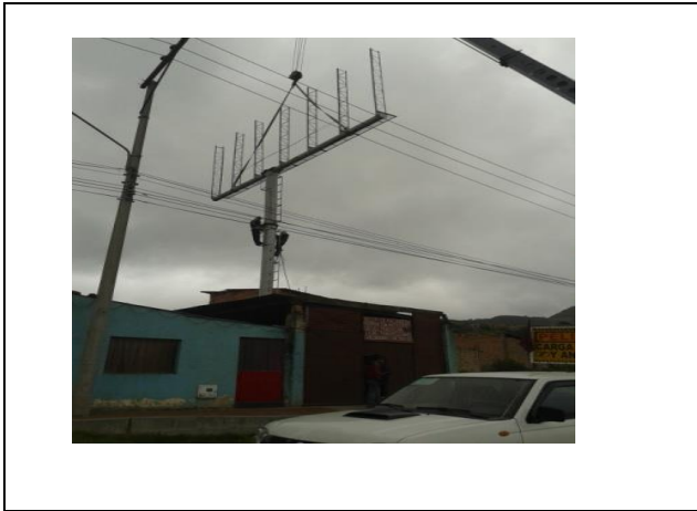
(Vista panorámica de la Valla)

La NO viabilidad y por lo tanto la negación del registro están sustentados en los considerandos del Auto No 03127 del 20 de Noviembre de 2013, ordenando el desmonte del elemento tubular; como quiera que el infractor no adelanto el desmonte La Secretaria De Ambiente procede a realizar el desmonte a costos del infractor.